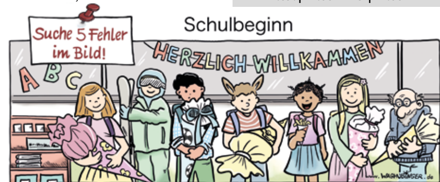
Skifahrer, Eiseschoren, Pommestüte, Willkommen, Opas