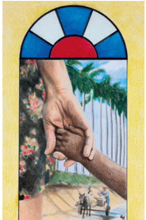
Grafik zum Weltgebetsstag